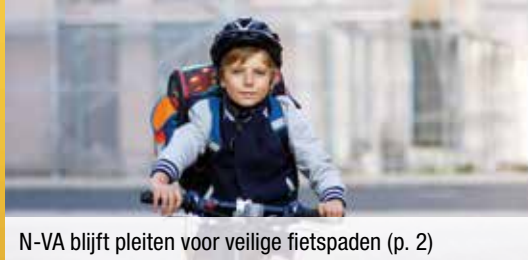
N-VA blijft pleiten voor veilige fietspaden (p. 2)