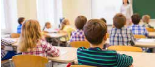
Keerbergen investeert in onderwijs p.2