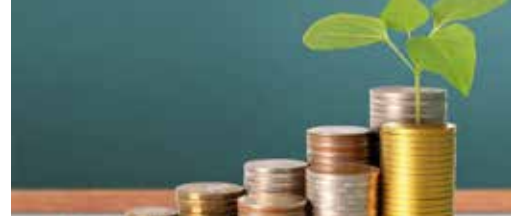
Gemeentelijke financiën weer op orde p.3