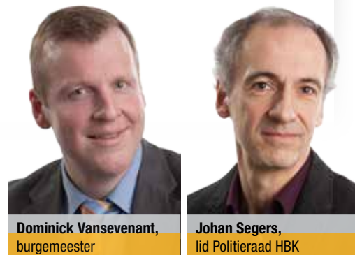
Dominick Vansevenant, burgemeester

Door de wet op de privacy is het niet altijd gemakkelijk om uit te pakken met successen van onze politie. Toch mogen we stellen dat onze sterke arm der wet veel misdaad oplost. Met ophelderingspercentages die voor sommige soorten delicten richting 50 % gaan en daarmee ver boven het nationale gemiddelde ligt, mogen we gerust op onze beide oren slapen. De N-VA investeert in veiligheid zodat u gerust kan zijn.