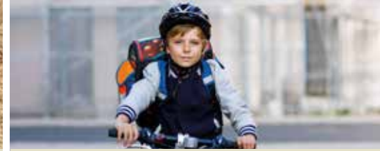
N-VA Keerbergen ijvert voor meer fietsveiligheid (p. 3)