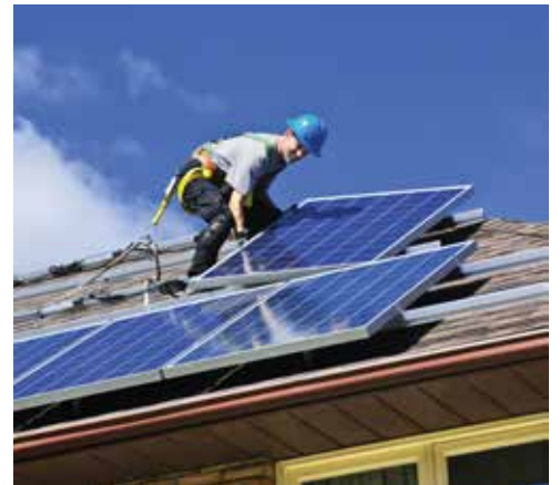
▲ De gemeente is eigenaar van de grootste gebouwen in Keerbergen. Ideaal om zonnepanelen op te plaatsen.

Nochtans heeft de gemeente alle middelen in huis om een efficiënt en effectief klimaatbeleid te voeren. “Met het gemeentehuis, de sporthal, GC Den Bussel en de gemeentelijke loods is de gemeente eigenaar van de grootste gebouwen in Keerbergen. Deze platte daken zonder slagschaduw lenen zich bij uitstek tot het plaatsen van zonnepanelen. Daarmee zou de gemeente in haar eigen elektriciteitsbehoefte kunnen voorzien en bij overproductie, Keerbergse gezinnen laten meegenieten van lokale groene stroom.”