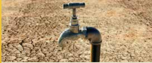
Tuin vraagt wadi (p. 2)